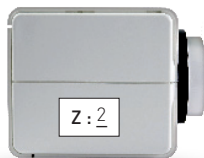
Исполнительный механизм, устанавливаемый в зоне 2