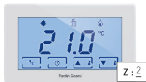
Термостат, устанавливаемый в зоне 2