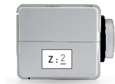
Actuador para instalar en la zona 2