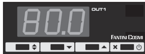
Fig.1 — Pannello frontale